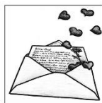
Dritter Advent: Liebe