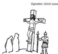
Karfreitag: Das Leben hinsetzen.