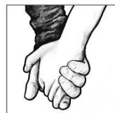
Zweiter Advent: Freundschaft